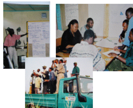
Seminário em Gestão de Conflito entre Homem e Animal 2004