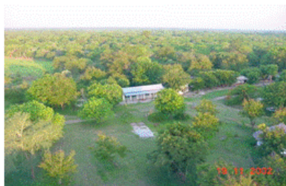
Sala de Aulas, vista aérea

O Centro de Treino localiza-se no acampamento de Chitengo, no Parque Nacional de Gorongosa, a 200 km da Beira e a 110 km de Chimoio. Seguindo a estrada nacional nº 1 em direcção à Vila de Gorongosa, 45 km depois de Inchope, há um desvio de 13 km para o interior até ao Portão Principal. Do Portão Principal ao acampamento de Chitengo são mais 17 km.